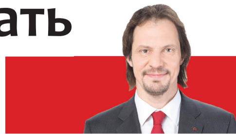
Индрек Саар министр культуры

В Эстонии за последние семь лет в воде погибло 415 человек, 28 из которых не было и 18 лет. В 2015 году в ходе исследования, проведенного Спасательным департаментом, выяснилось, что 62% родителей дают неудовлетворительную оценку умению своих детей (7-18 лет)