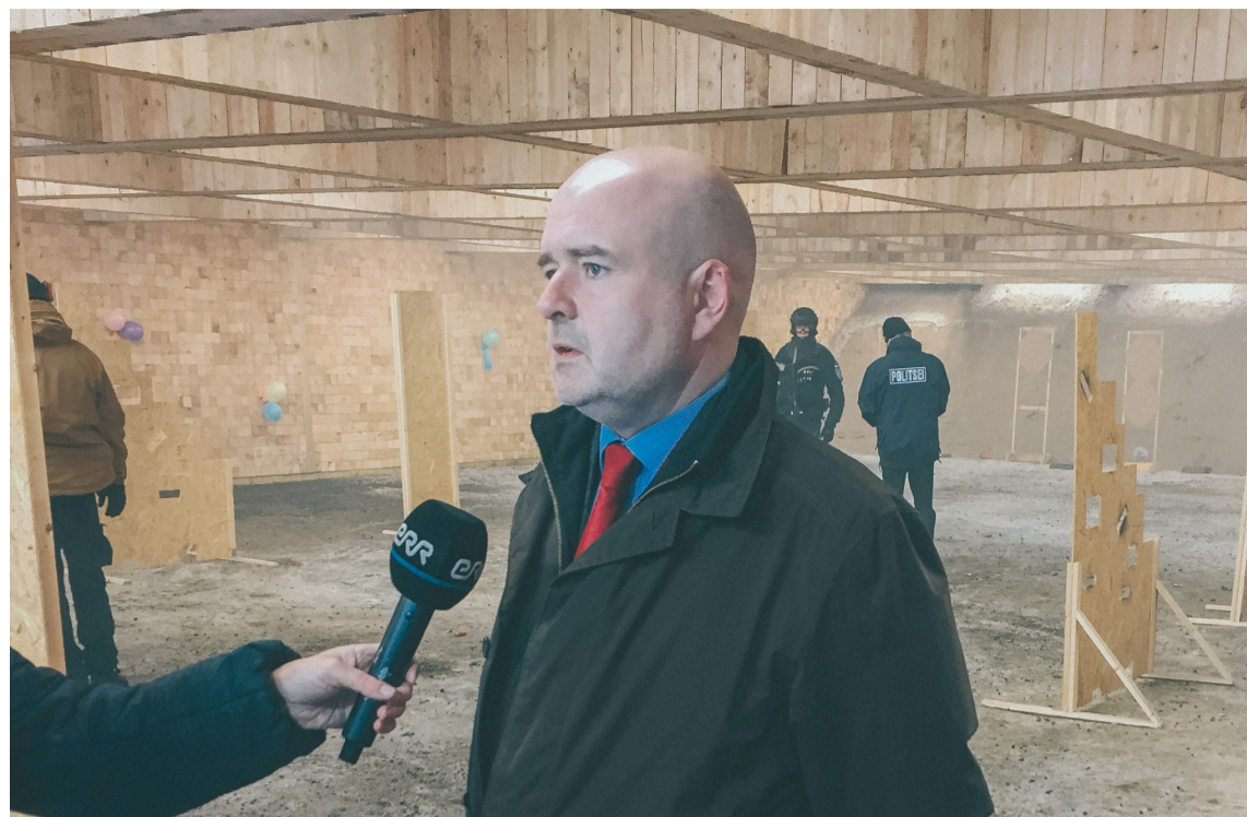
Министр внутренних дел Андрус Анвельт в полицейской школе в Пайкузе.

Издатель: Социал-демократическая партия Адрес: Тоомпуистеэ 16, Таллинн 10137 Телефон: 611 6040 Дополнительная информация: ajaleht@sotsdem.ee