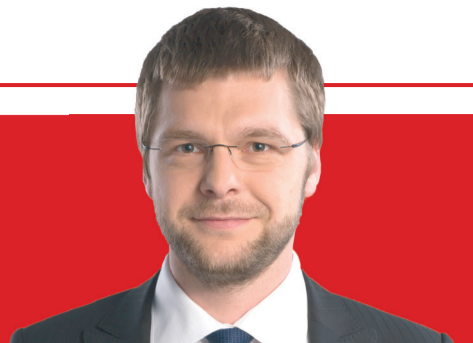
Евгений Осиновский председатель СДП