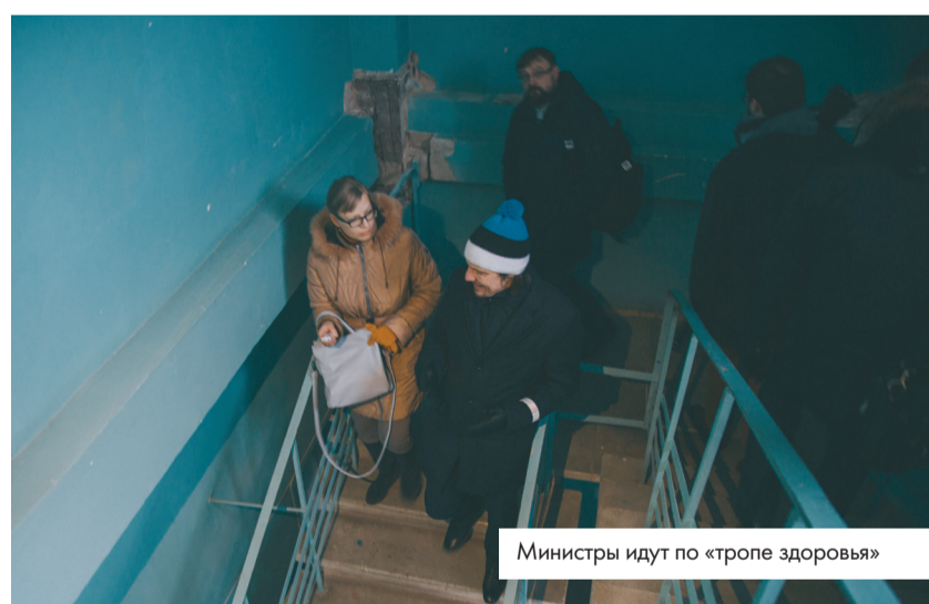
Министры идут по «тропе здоровья»

В здании бывшего завода «Балтиец» холоднее, чем на улице. А на улице, к слову сказать, в начале февраля был крепкий минус. Но прибывшим на экскурсию министру культуры Индрекку Саару и министру предпринимательства Урве Пало мерзнуть не пришлось - гид ждал их на крыше, подняться на которую можно лишь пешком - а это ни много ни мало 10 этажей. Чем так заинтересовал министров заброшенный завод? Об этом наш небольшой репортаж.