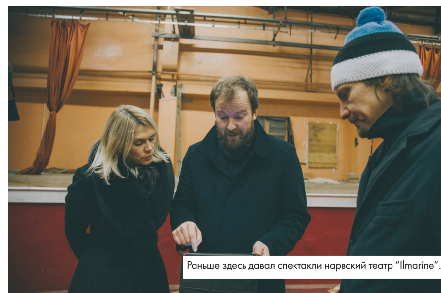
Раньше здесь давал спектакли нарвский театр «Ilmarine».