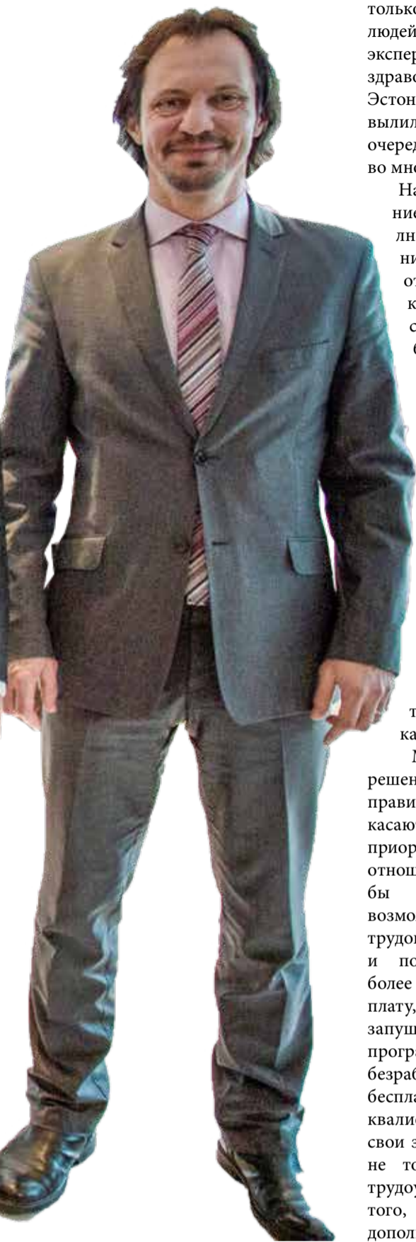
– в обществе, где доля людей старшего возраста с годами только увеличивается, «общественный

кошелёк» для оплаты медицинских услуг не может пополняться только за счёт работающих людей. Опасность, о которой эксперты Всемирной организации здравоохранения предупреждали Эстонию уже 15 лет назад, вылилась в проблемы с длинными очередями к врачам-специалистам во многих отраслях.