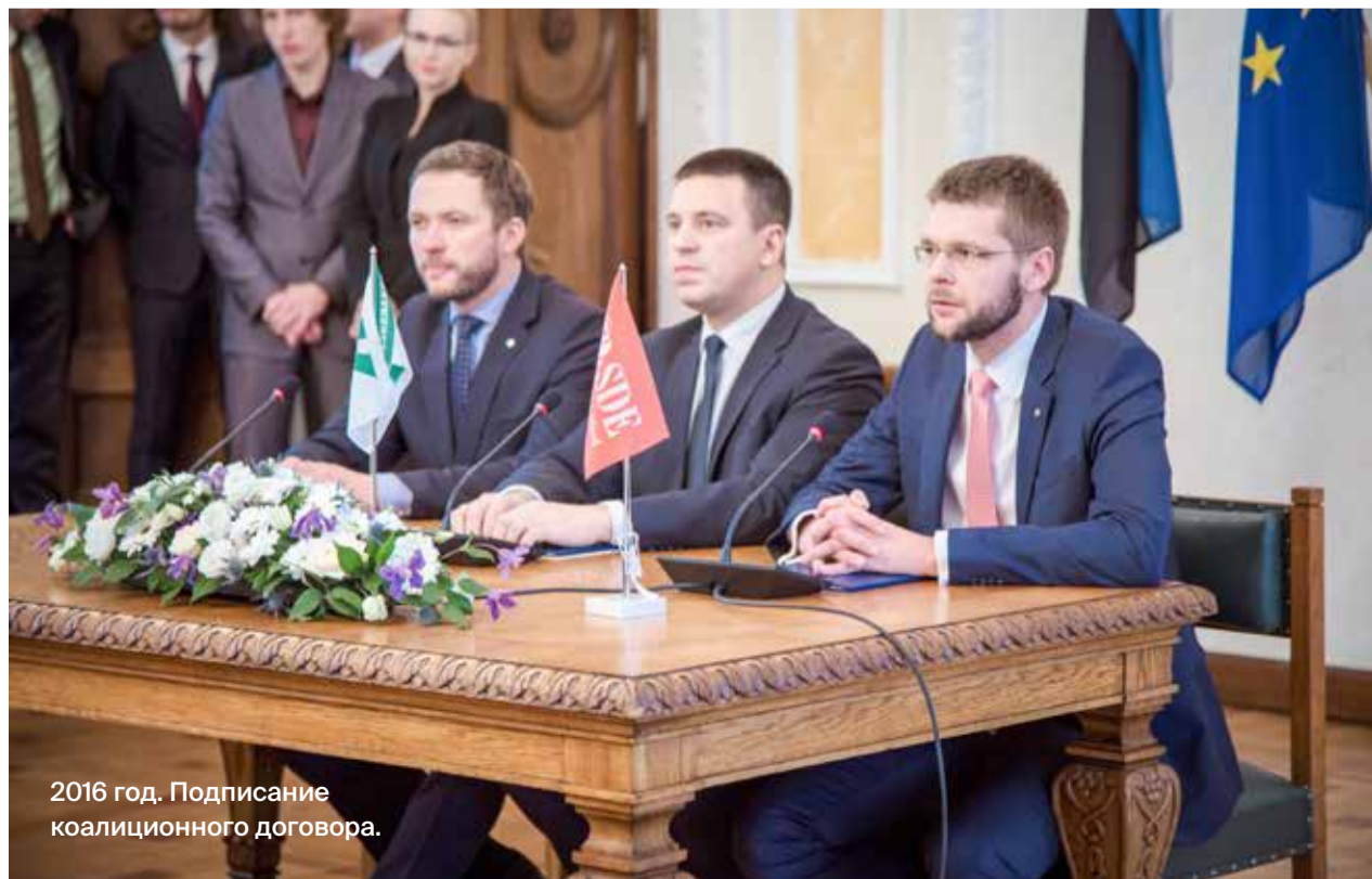
2016 год. Подписание коалиционного договора.

подчеркнул, что безопасность – это не товар класса люкс, она должна быть доступна каждому, независимо от финансового положения и состояния здоровья. Для существенного сокращения количества случаев гибели людей в пожарах нет другого способа кроме инвестиций в домохозяйства. «Что касается возможностей служб спасения, мы уже находимся на самом высоком европейском уровне по показателю скорости реагирования. Мы можем приобрести еще десяток высокоскоростных спасательных машин, но это не поможет, если печь в доме разваливается, а денег на её ремонт нет», – сказал Андрус Анвельт. 🍀